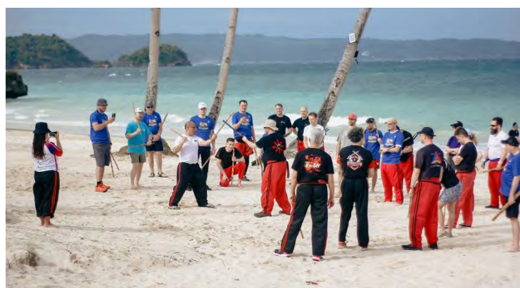
Training am Strand der Newcoast Boracay

Am Nachmittag begann das Meet and Greet am Strand (Vorstellung der Großmeister/innen) und danach ging es zum Welcome-Dinner.