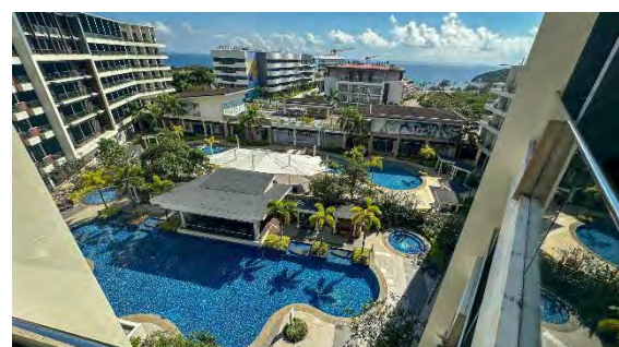
Savoy Hotel Newcoast Boracay