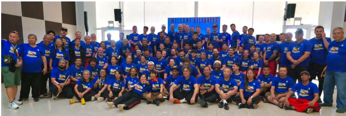
Die Teilnehmerinnen und Teilnehmer des FMA Festivals auf Boracay