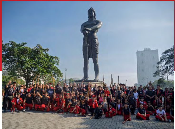
vor der Lapu Lapu Statue im Rizal Park Manila

Am Wochenende vor dem Festival fand in Intramuros und dem Rizal Park in Manila das 1. Sentinel Gathering statt, bei dem der DAV ebenfalls mit 20 Personen vertreten war.