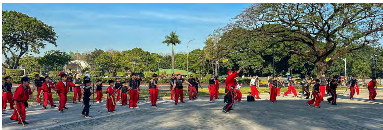
Training beim 1. Sentinel Gathering vor der Lapu Lapu Statue im Rizal Park Manila

Das Gathering war bewusst kein klassisches Seminar, sondern ein offenes Treffen. Techniken, Konzepte und persönliche Interpretationen wurden respektvoll geteilt. Besonders bereichernd war der generationsübergreifende Austausch zwischen erfahrenen Lehrern/innen und jüngeren Arnisadores, der zeigte, wie lebendig und wandelbar das System ist.