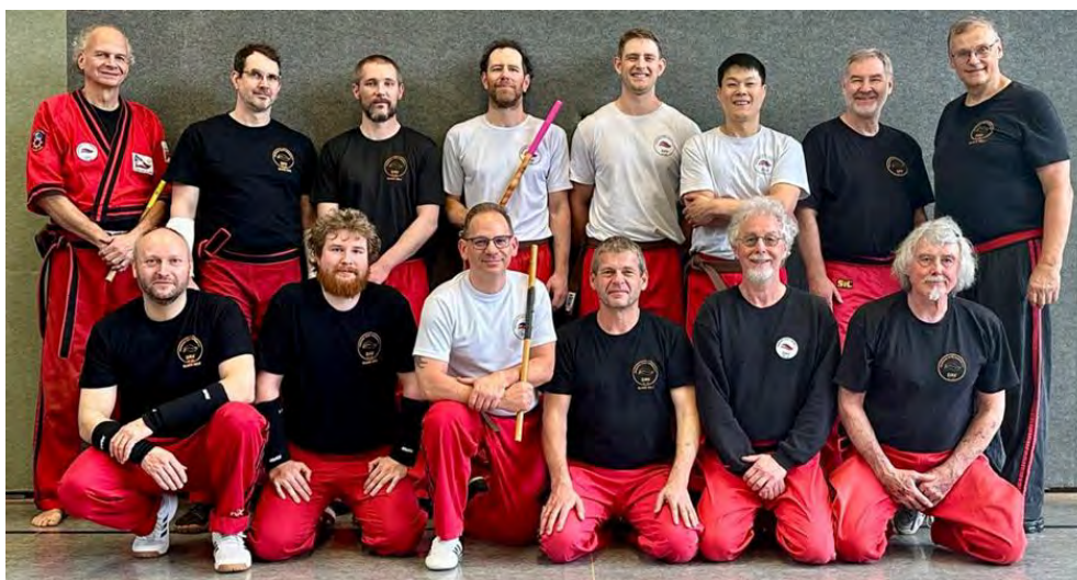
Teilnehmer des DAN-Lehrgangs

Die erste Gruppe arbeitete innerhalb ihres jeweiligen Prüfungsprogramms und erhielt zahlreiche wertvolle Tipps vom Großmeister für die nächste Gürtelstufe. Die zweite Gruppe trainierte verschiedene Messerdrills, bei denen insbesondere Timing, Distanzgefühl und kontrolliertes Arbeiten im Mittelpunkt standen.