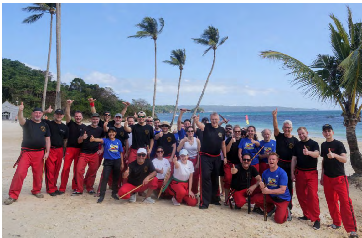
Die Delegation des DAV am Strand der Newcoast Boracay