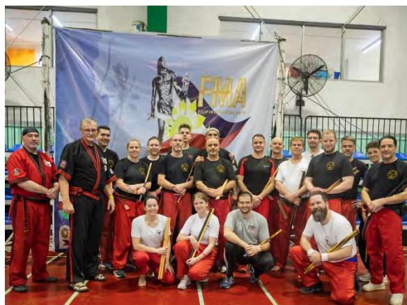
Teilnehmer/innen des DAV am 1. Sentinel Gathering

Circa 150 Praktizierende aus 10 verschiedenen Ländern und unterschiedlichen Stilrichtungen kamen zusammen, um gemeinsam zu trainieren, Erfahrungen auszutauschen und die gemeinsamen Wurzeln dieser philippinischen Kampfkunst zu würdigen. Dabei stand nicht die Abgrenzung einzelner Ansätze im Vordergrund, sondern das Verbindende – die Prinzipien, die Modern Arnis ausmachen.